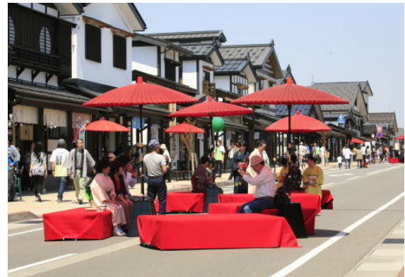
平成 22 年 5 月に牧之通り竣工記念イベントとして、「牧之通り千人茶会」を開催する。このお茶会は今後も継続予定。