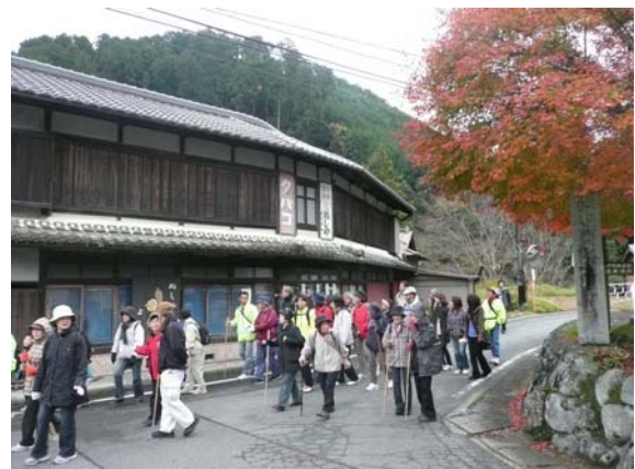
伊勢本街道 奥津宿のまちなみ。かつて宿場として栄えた奥津宿には、数多くの屋号が残されており、歴史ある家々に暖簾をかけて昔の面影を保存している。