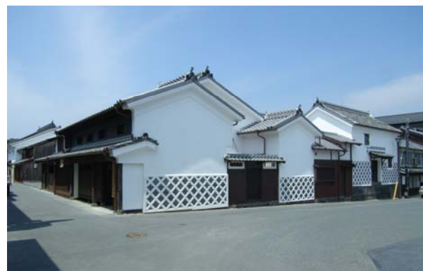
まちづくり交付金事業で保存修理された浜崎町並み交流館の「旧山村家住宅」(伝統的建造物)。浜崎しっちょる会が管理運営している。