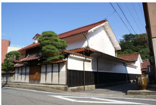
天領江津本町 豊街道。江の川の舟運と北前船の寄港地であった江津本町地区にはかつて数十軒の廻船問屋が建ち並んでいた。いくつか現存するそれらの建物と石州赤瓦の景観が良質に残されている当地区は、天領江津本町豊街道として、赤瓦の街なみを活かした新たな地域おこしが始まっている。