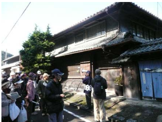
伊勢本街道（奥津宿）のまち並み。それぞれの家紋や屋号にちなんだオリジナル溢れる手づくりの暖簾は、かつての宿場町の趣を演出している。ウォークイベントなどでは、語り部の案内にも力が入る。