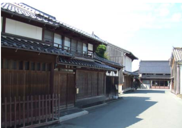
江戸期からの伝統的建造物の町並み。廻船問屋や仲買商人の町家が軒を連ねている。

萩市と「浜崎しっちょる会」のこの10年以上にわたる地道な協働の取り組みによって、現在地区が現在活性化していることを高く評価し、都市景観大賞「優秀賞」にふさわしいと考えられる。(卯月)