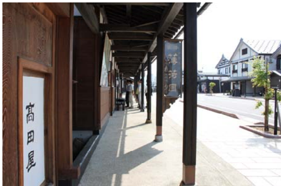
雁木内を歩く歩行者の目線での写真。歩道（3.5m）と雁木（2mセットバック部）の公共・公的空間により夏の日差しや冬の降雪期においても、広くゆったりした快適な歩行空間を提供している。