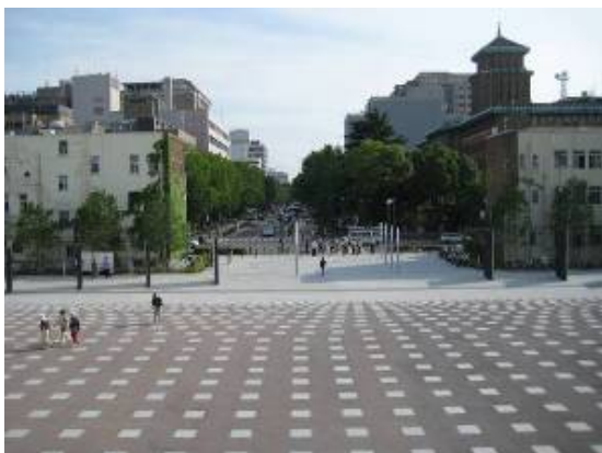
象の鼻パークから日本大通りを見る。