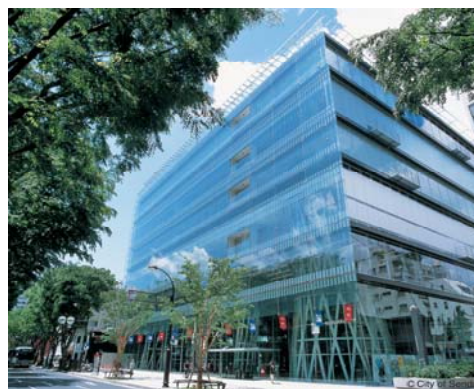
平成 12 年に「せんだいメディアテーク」が完成。多くの来館者を擁し、定禅寺通沿道を代表する施設となっている。