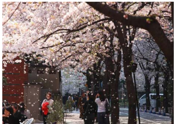
1986 年の再開発で新設された区道（通称：さくら坂）はさくらの名所として、多くの花見客で賑わう。