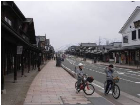
雁木の連なる牧之通り。2mのセットバック空間に雁木を設置。

街道のもたらした富と文化は沿道の家々に控え目に再生され、本物の質を持つ雁木がリズムカルに人々を繋ぐ。細部や店先の表情には家主の気配りとプライドがにじむ。与えられたルールに従うのではなく、自立した個性の協調としてまちづくりを行ってきたことが、牧之通りの雰囲気を決めている。それはただ単に色や意匠をそろえただけでは出てこない。写真に写る姿や様々なイベントの賑わいの様子以上に、その雰囲気と冒頭に述べた場所の感覚の創出に敬意を表したい。景観とは、その向こうにある人々の暮らしと文化を翻訳するものだ。雪国の育んだ町の力を思い知るまちなみである。（佐々木）