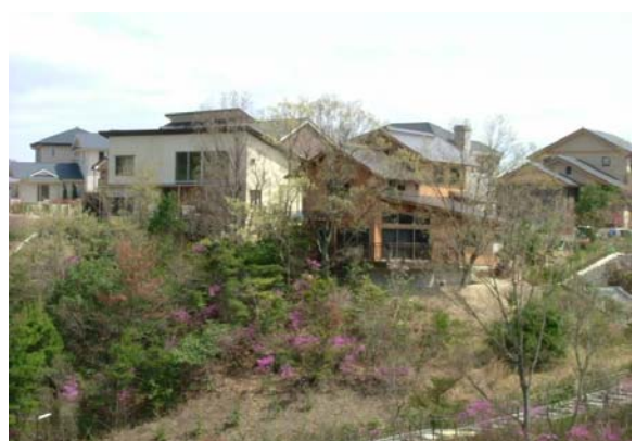
宅地内の現況林。春にはコバノミツバツツジが彩りを添える。