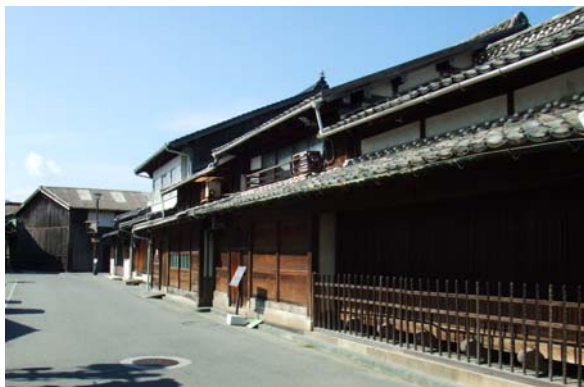
当地区には廻船問屋や仲買商人が町屋を連ねており、今もその建物が軒を連ねている。