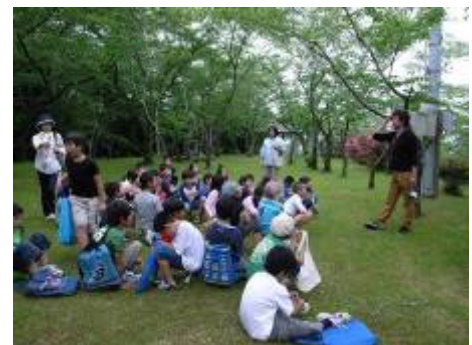
子供たちオススメの場所へデザイナーを案内した様子。小さな公園にもそれぞれの楽しみ方があった

この取組みの一環として、小中学校への出前授業の実施や、一般向けの文化財巡りなど、既存事業を活用した普及啓発を図る他、小学校と連携して児童とともにまち歩きやワークショップの開催により地域を歩くマップづくりを行っている。児童の目線と文化財の視点を融合させた地図は、今後地域学習や観光に活用される予定になっている。