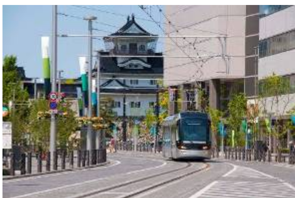
大手モールから富山城址方面を望む。トランジットモールの景観を指し歩車道を自然石で一体舗装とした。

市街地集約の時代にいち早く取り組み、トータルデザインをまとう富山市のLRTに関する施策はあまりに高名である。今回の応募地区はその第2ステージともいえるべき、市内電車を環状につなぐ路線の新設と、「セントラム」と呼ばれるLRTの運行、その沿道地区における景観形成への取り組みである。都市景観が単なる見た目だけでなく、また言い換えるなら写真のように風景を切り取ってそのデザインの善し悪しを語るものだけでなく概念であることは浸透しつつある。このような観点から、市街地集約施策を目に見えるLRTで表し、それを実績あるデザイン事務所の手による洗練された意匠で実現している点は、新しい時代の景観のあり方として高く評価できる。一方で今回の応募地区は、その市の施策全体と呼ぶには地区が限定されすぎており、また施策による波及効果などを測るにはまだ時間不足であることも指摘できる。これらの判断から優秀賞として表彰するものである。(高見)