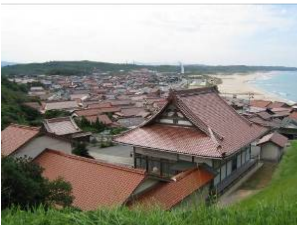
石見焼の積み出し港「波子地区」の町並み。

江津市は、日本三大瓦産地の一つであり、石州赤瓦で名高い。この街の各地には、今でも随所に赤瓦集落が点在し良好な景観が保たれている。こうした、景観資産を保全再生してきた、江津市の取り組みは、高く評価するに値する。元来、歴史的に良好な都市景観は、建材を地産地消することによって、統一感ある調和が保たれてきた。しかし、現代の建材の多様化と流通の進化によって、全国の町並みは、均一的カオス状態へと陥っている。このことは景観法に基づく、景観条例や景観ガイドラインなどにおいても打破し切れていない。それは、「既存不適格」への過度な配慮から、現状追認的な枠組みが多くなっているからだろう。それに対し、江津市の姿勢は「赤瓦」にあえて限定し、大きな成果をあげている。また、学校教育においても、「赤瓦」を通じた、郷土への愛着を醸成するなど、幅ひろい取り組みを行っている点が特筆される。また、シビックセンター地区など、新たに開発された地域においても、「赤瓦」の導入を積極的に起こっており、遠景としての統一感が形成されている。今後は、こうした新たな施設における、「赤瓦」の適切なデザインが課題となるだろう。(田中)