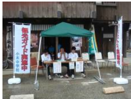
宿根木集落の路上で観光ガイドの受付をする様子

こうした活動を通して、町並みや景観への関心を高めるとともに、世代を越えた交流も活発になされている。