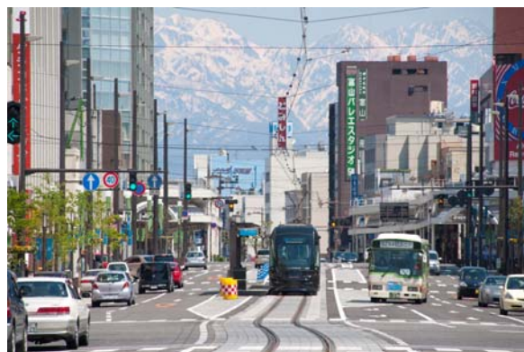
平和通りから立山連峰(東側)を望む。富山の象徴的なシンボルである立山連峰を借景とする平和通り。シンボルロードの軸性と商業エリアとしての賑わいを併せ持つ景観形成を目指した。