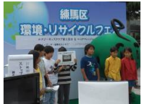
練馬区環境・リサイクルフェアの会場で、校内や町のエコスポットを紹介している様子

私たちの町に言葉の贈り物は、自分たちの町の景観を改めて見つめ、言葉にする活動を通して、地域の環境、自然、人、自分の育ち、町の良さなどを感じ、心の豊かさを培う目的で実施している。