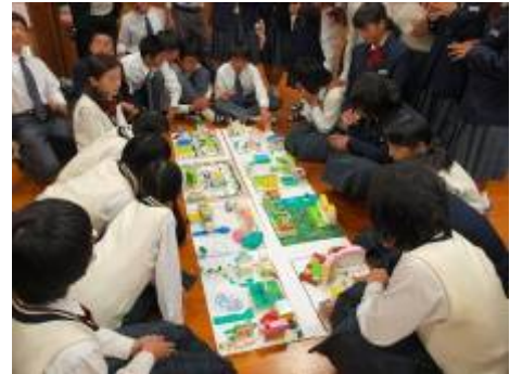
グループごとに街並み模型を作成し、それらをつなげて、あるべき景観を検討している様子

これらの活動及び成果は報告書にまとめ、市内の各中学校や関係団体等に配布するとともに、市ホームページに掲載し、広く啓発を行っている。