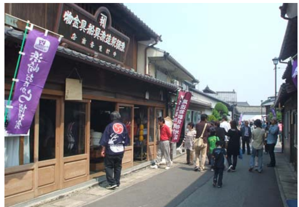
伝統的建造物群保存地区補助事業により修景された船具店。1階の引き戸、2階の出格子、銅製の看板、瓦屋根等の保存修理を行った。今では、ボランティアガイドのコースの一つとなっている。