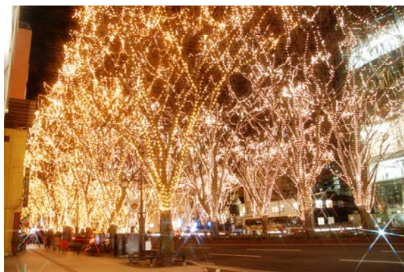
SENDAI 光のページェント。市民ボランティアの実行委員会主催。今年度で 25 回目。160 本のケヤキに約 50 万球(全て LED 電球に変更)の電球を装飾。