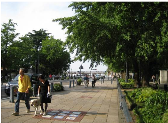
日本大通りから象の鼻パークを見る。日本大通りの突き当たりに有った倉庫を撤去し、象の鼻パークを整備したことにより、日本大通りから海が見えるようになった。

ともすると都市景観大賞においては、歴史的町並みへの評価が高くなりがちであるが、この横浜の計画は、新たな開発行為においても、十分に魅力的な空間を生み出せることを実証していると言えるだろう。(田中)