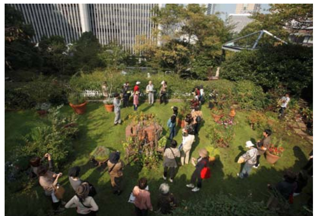
一般を対象として開催される屋上庭園見学会。講師が解説の様子。