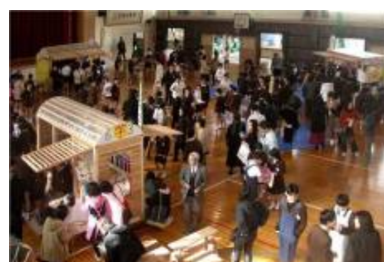
みんなの手作りで完成した夢空間を使って発表会を開催。子供たち自身が企画し、家族や下級生を招いて開催した。

どこの都市でも中心市街地の衰退が顕著となってきている。日向市においても抜本的な都市構造改革が求められてきた。そこで1998年から「街なか賑わいと活気があふれる木を活かしたまちづくり」を計画コンセプトとする「魅力再生プロジェクト」がはじまった。4年間の構想・計画段階を経て、2002年から「日向地区都市デザイン会議」が宮城県と日向市の所管で設置され、多様な多彩な専門家チームと関係機関との相互協力体制のもと、「駅の再生なくして街の再生なし」という哲学で、まちづくり事業としての木造大屋根の駅舎を中心としてプロジェクトが展開されてきた。さらに事業と連動させて「景観まちづくり学習」を継続的に展開することで、次世代を担う子どもたちと共に家族やその関係者への意識啓発を目指して実施されたのが、課外授業である。その課外授業は一過性で終わるのではなく、学校の授業時間を活用しながら子どもたちの発達に応じて、実物による展開に大きな特徴がある。小学校では、3つの子どもの参加型学習(10時間、40時間、12時間)を、中学校では、10時間の授業、工業高校では、約1年間をかけての授業を展開し、①子ども達の意識啓発、②専門家と連携した学習によるモノづくりプロセスの実体験、③学習・イベントによるまちなか利活用の意識促進が進められてきた。こうした取組みは、子ども達の街に対する意識向上、関係者の交流ネットワークの形成、まちづくり学習を契機とした市民活動の活発化につながっているプロセス重視の実践であり、大賞に値する取組みとして高く評価できる。(小澤)