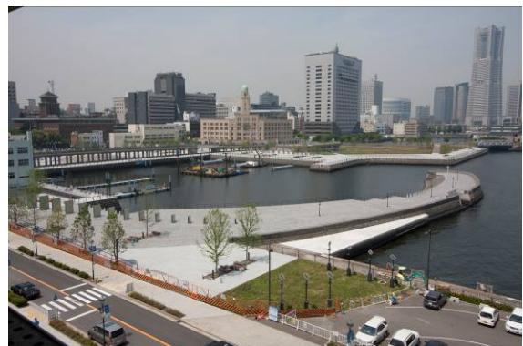
象の鼻防波堤が復元された。