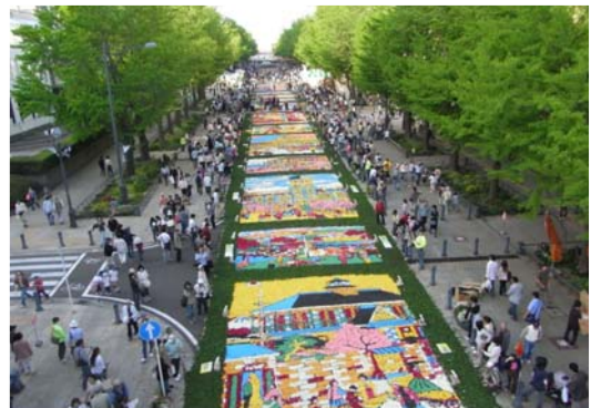
市民参加により行われた日本大通りフラワーアートフェスティバル。