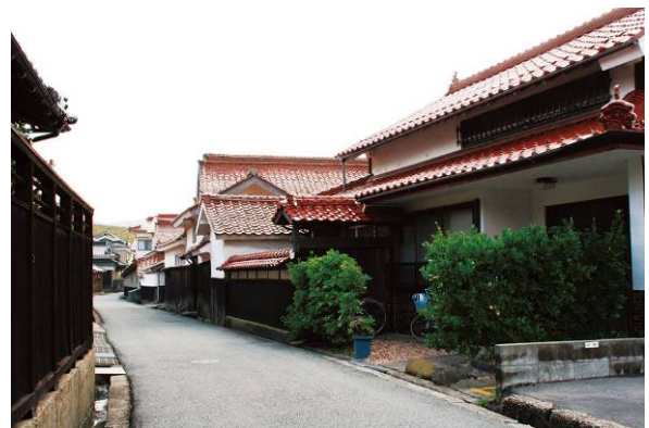
都野津町のまちなみ。古くから石州瓦の生産工場が立地し商業のまちとしても栄えた都野津地区には、いまなお通りに面して赤瓦の住宅が建ち並び、まさにこの地の基幹産業が窯業であったことを物語っている。