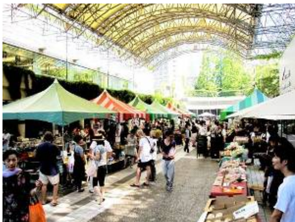
再開発上の公開空地であるカラヤン広場は、年間を通じて様々なイベントに活用されている。