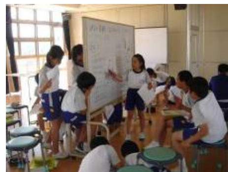
グループごとに調べる事項について話し合っている様子

子供たちは、各学習及び全体を通して、「気づく・調べる・考える・行動する・表現する・発表する」ことを学ぶとともに、自分の住んでいる地域 (ふるさと) に誇りや愛着などを醸成しつつある。保護者も子供たちがまとめた新聞等を見たり、活動の様子を子供から聞いたりすることで、自分たちの住む地域を再発見することにもつながっている。