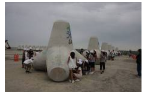
日和山海岸のテトラポットに絵を描く子供たち

子供たちはこうした自らの体験活動を通して、改めて地域の良さを見直し、ふるさとの愛着や誇りを醸成しつつある。