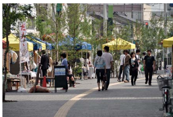
大手モールの歩道で開催された、市民と行政が協働で運営している越中大手市場。