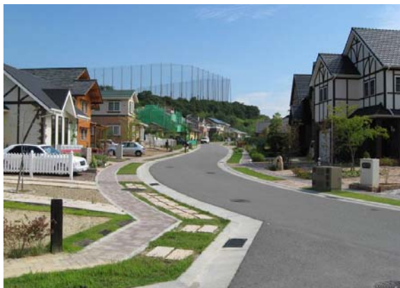
区画道路に面して、宅地内に2mのセットバック空間を確保し、セミパブリックな歩行空間として、また電線類の地下埋設空間として利用している。