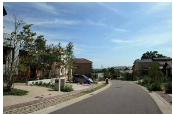
建築協定によるセットバックと電線類の地中化により、オープンな明るい景観を創出。