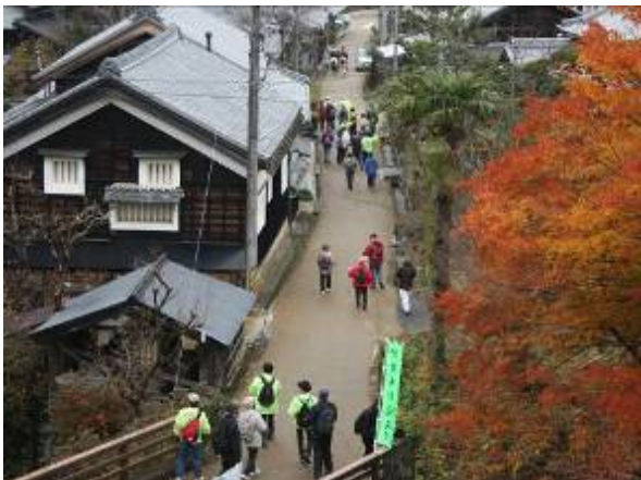
伊勢本街道（谷町）のまち並み。街道の雰囲気と合わせた自然色舗装。周辺には歴史ある町並みや常夜燈、道標などが数多く残されている。

津市美杉町伊勢本街道周辺地区は、住民と地域づくり協議会、津市、三重県などの複合主体が、有機的な連携のもと、街道という歴史的な情緒を活かした景観まちづくりの取り組みが、住民の地域に対する愛情を醸成し、修景整備のみならず、歴史文化の伝承や地域内外の人材交流を牽引した事例として高く評価できる。特に宿場町という特性を活かした家紋や屋号による暖簾づくりや、地元の木材をつかった手作りの屋号看板や案内版などによる趣の演出が、「もてなしの景観まちづくり」を住民自らが楽しむ行為につながっていること、さらには、協議会主催のウォークイベントや語り部研修会や歴史勉強会の実施、空家情報バンク等の運営など、地域の持続性を担保する各種の活動を実施していること等、景観まちづくりを支えるソフトの仕組みが充実している点なども、受賞に値する。さらに、森林セラピーやデザイン専門学校に「美杉のブランド化に関するカリキュラムの導入」など、今後の新たな展開も期待できる。（池邊）