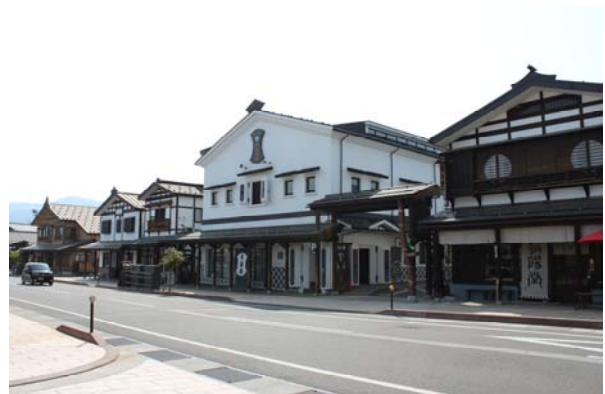
塩沢信用組合もまちづくりに賛同し、建物を蔵造り風の 2 階建で改装を行った。