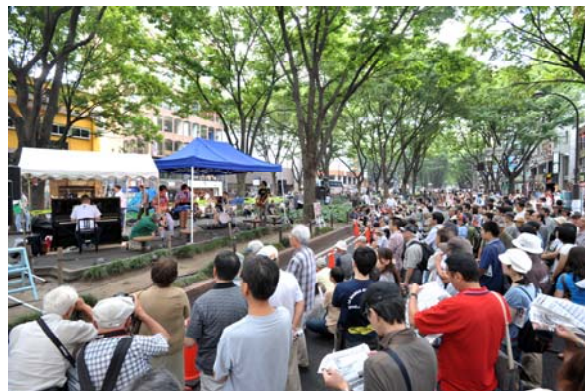
定禅寺ストリートジャズフェスティバル。市民ボランティアの実行委員会主催。今年度で 20 回目。750 グループ以上の参加、70 万人以上の観客数の祭典に成長。