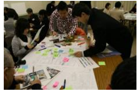
まち歩きで見つけた良い景観や悪い景観、魅力や課題、提案等をグループごとにまとめている様子