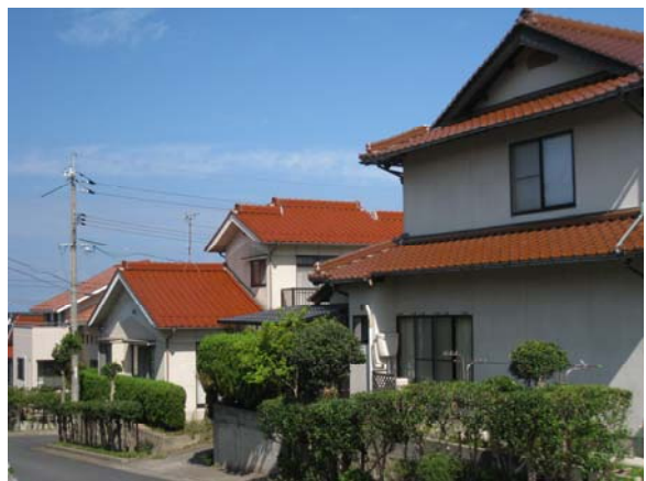
建築協定による赤瓦の街なみ誘導。市内の2地区（住宅団地）では住民による建築協定が締結され、赤瓦の街なみが形成されている。