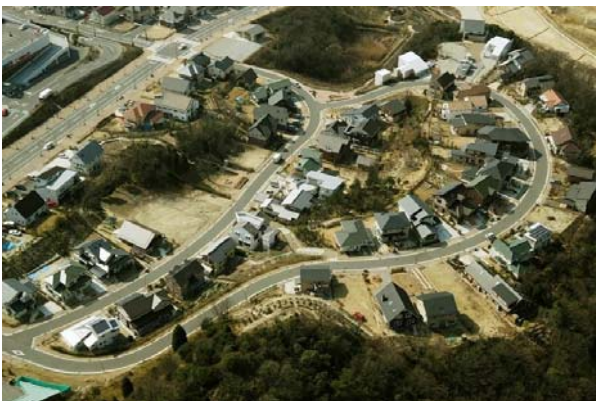
地区を上空から望む。道路は地形に沿ってなだらかな曲線で構成。現況林を含む平均約700㎡の大規模な64区画の宅地が並ぶ。

郊外戸建て分譲住宅地の建設に新しい計画哲学を導入し、その実践によって魅力ある都市景観と豊かなコミュニティを形成したことから、都市景観大賞「国土交通大臣賞」にふさわしいと考えられる。（卯月）