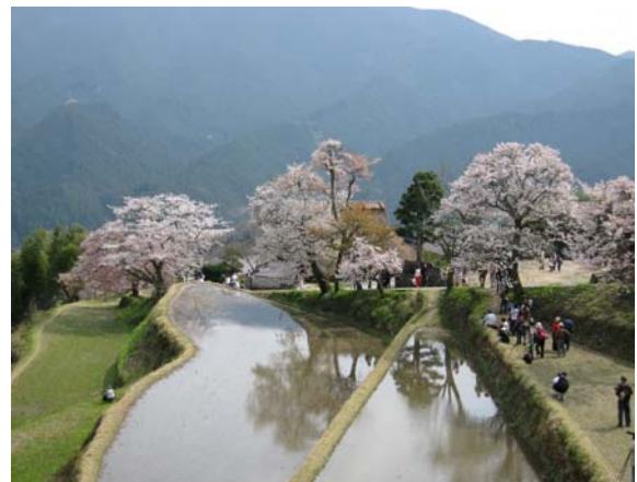
「三多気の桜」周辺のまち並み。「桜名勝百選」に選ばれた三多気の桜は、3月下旬～4月上旬にかけて、県内外から多くの来訪者を迎える。伊勢本街道を軸として、周辺の地域資源を生かしたウォークイベントなども多数開催されている。