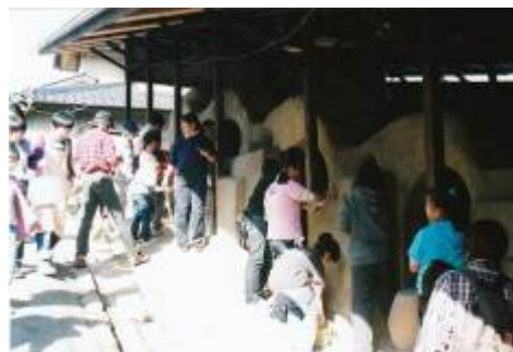
まちの大事な宝物である「登り窯」をみんなの手で修復している様子

仙台市において、「未来のまちを担う子供たちに、より良い景観まちづくりへの意識の芽を育みたい」という想いを共有する仲間（建築・デザイン関係の専門家、行政職員等）が集まり、建築や都市の創造的なデザイン手法を使った教育プログラムを作成し、学校、地域、公共施設や様々な団体と協働しながら、「未来のまちのデザイン講座」、「小学校における景観まちづくり学習」、「歴史的建造物保全・活用ワークショップ」などの活動を継続的に実施している。