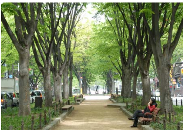
シンボルロード整備(緑の文化回廊)により、中央緑道を整備。

地元関係者によるまちづくりの活動は世代を超えて継続され、これからも質の高い潤いのある多面的な街並形成への展望が窺える。(富田)