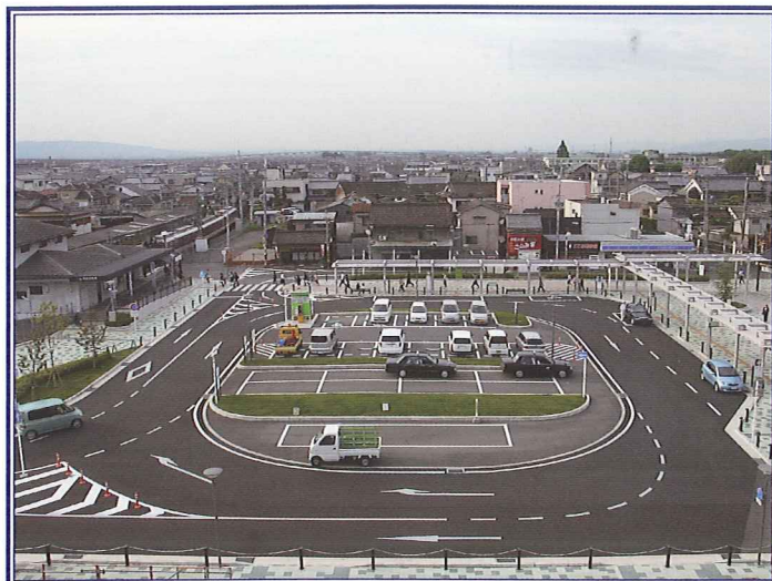
事業名：田原本駅前広場整備事業 事業者：奈良県田原本町