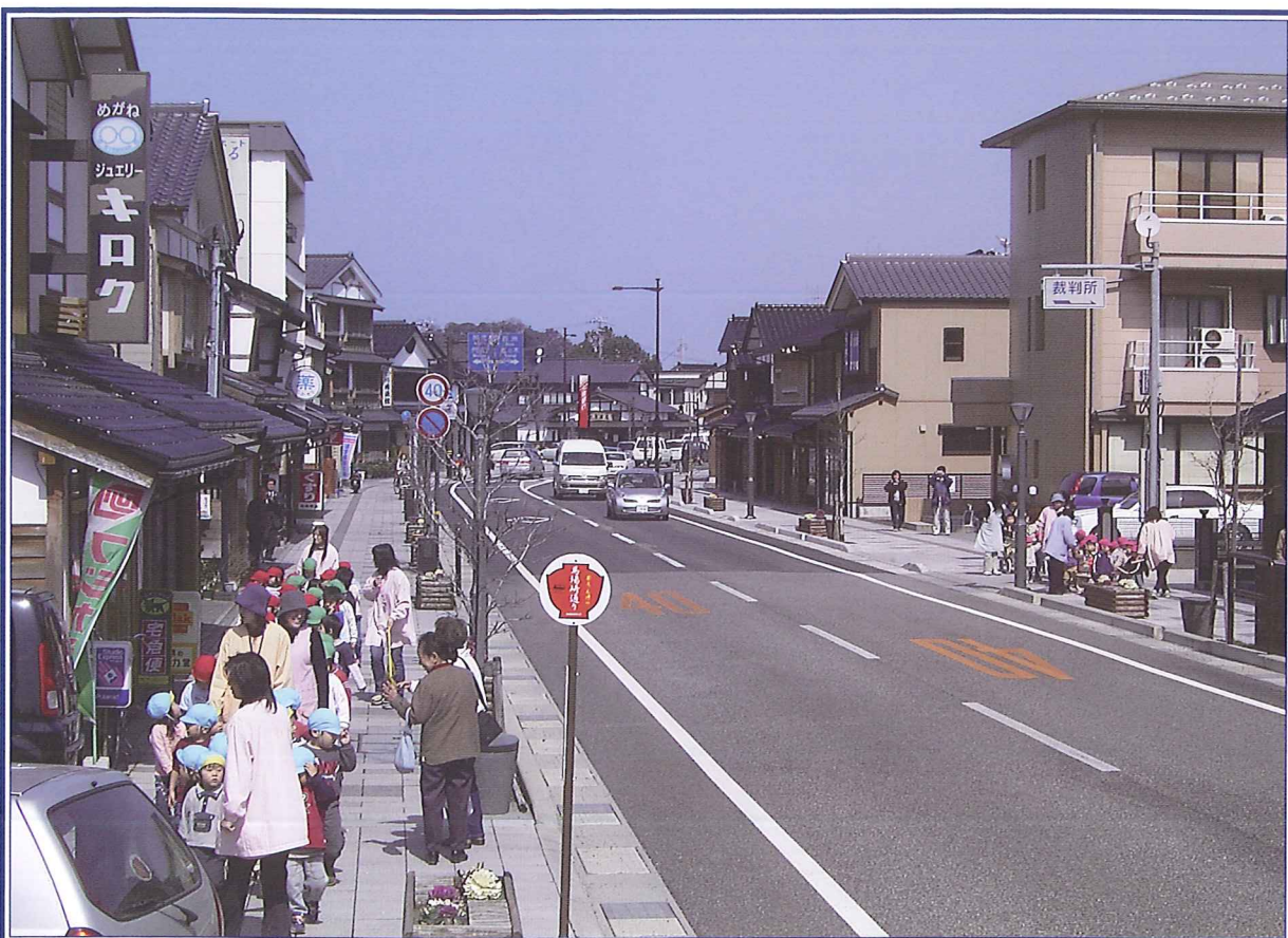
事業名:都市計画道路 河井町横地線 街路事業 事業者:石川県土木部都市計画課