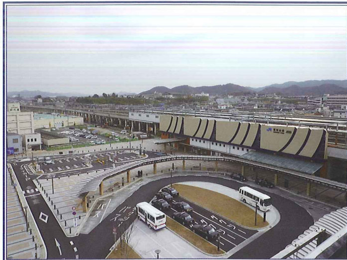
事業名：福知山駅付近連続立体交差事業 事業者：京都府