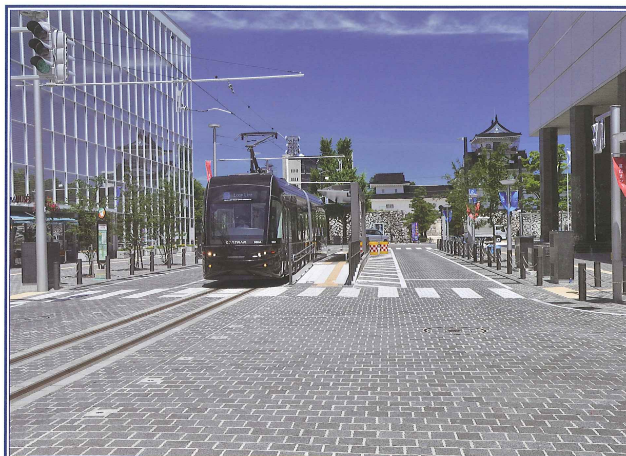
事業名:市内電車環状線化事業 事業者:富山市