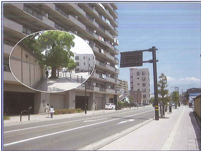
事業名：金沢都市計画道路3・4・15号 橋場若宮線 事業者：金沢市都市整備局土木部道路建設課