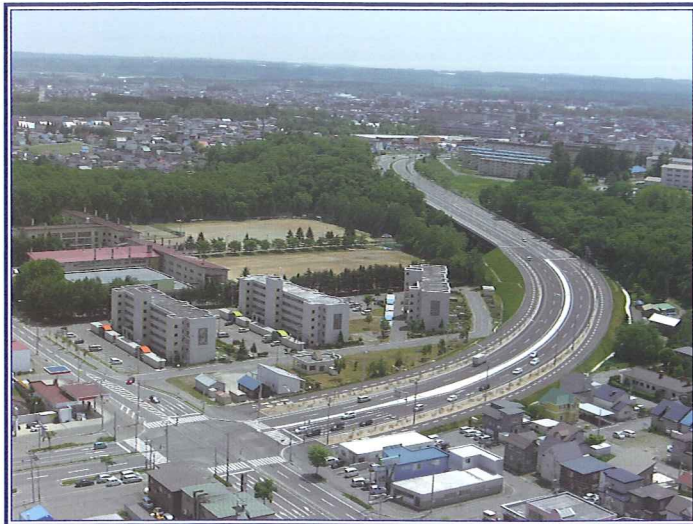
事業名：帯広圏都市計画道路事業3・3・46号弥生新道 事業者：北海道十勝総合振興局 帯広建設管理部