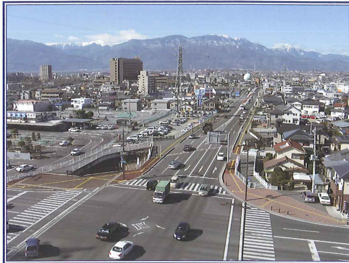
事業名：甲府都市計画道路 愛宕町下条線整備事業 事業者：山梨県県土整備部都市計画課