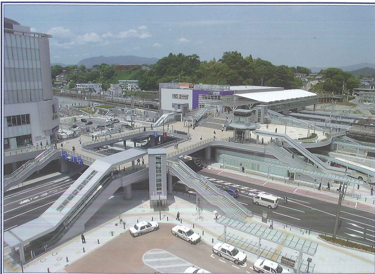
事業名:いわき駅周辺交通結節点整備事業 事業者:いわき市都市建設部都市整備課