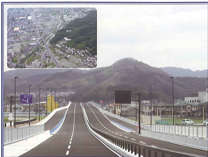
事業名：中和幹線 桜井東・慈恩寺工区 事業者：奈良県土木部まちづくり推進局・桜井市 産業建設部