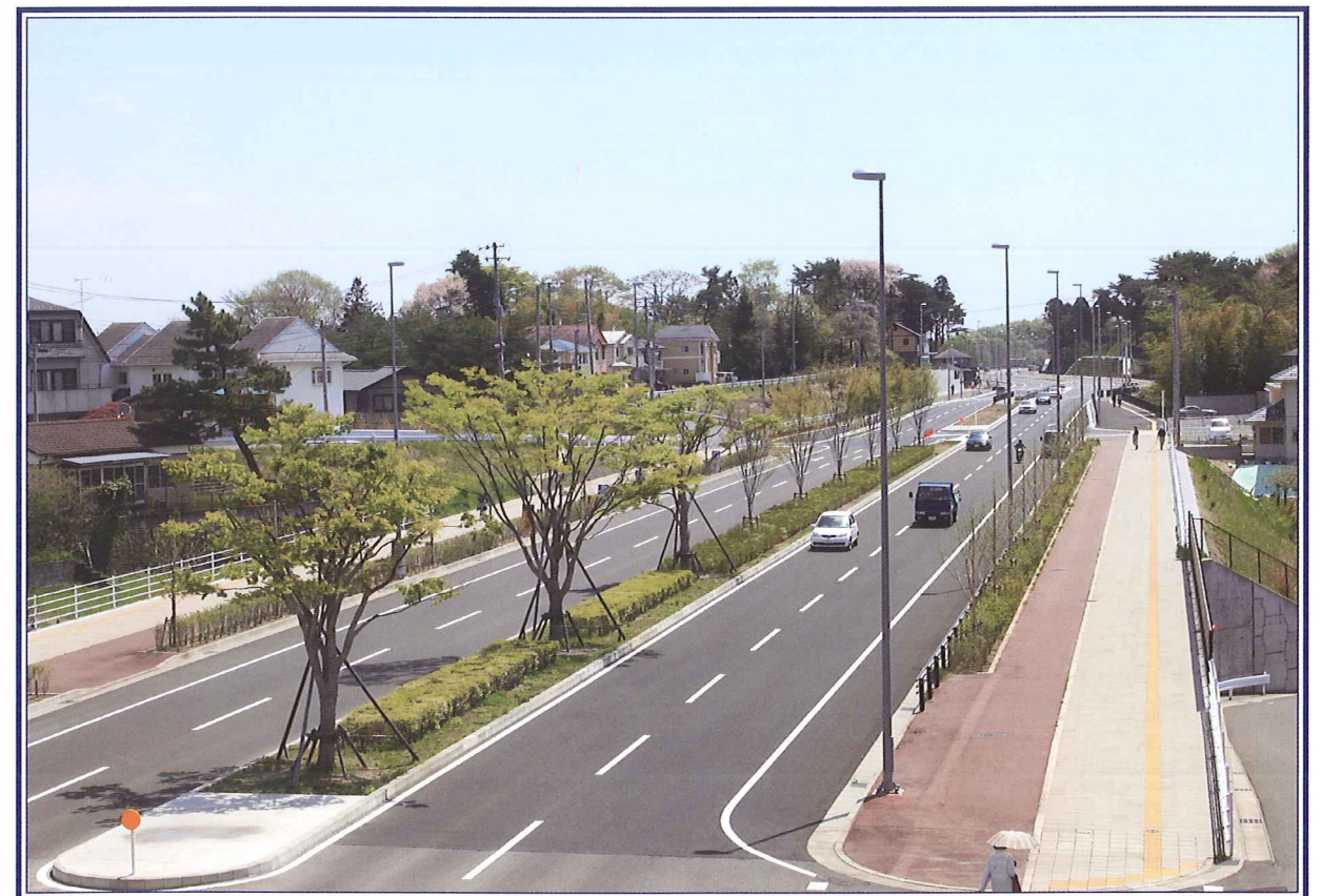
事業名：川内南小泉線(安養寺工区)道路改築事業 事業者：仙台市建設局道路部