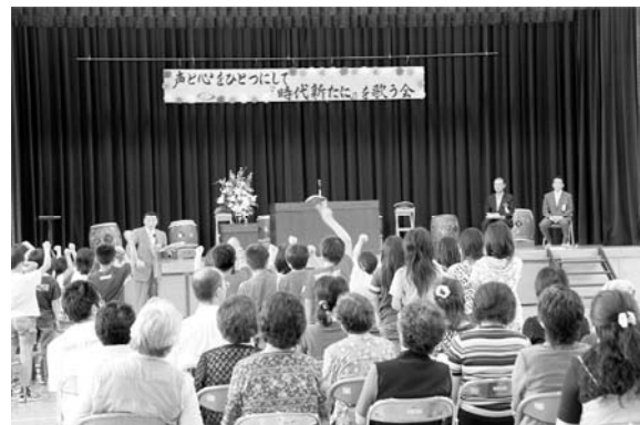
■市歌「時代新たに」を歌う会（赤石小学校）

2 わかあゆ はつらつ 若鮎はねて 澆刺と うおの なが 流れ せ 瀬もはずむ そだ いね ほ 育つ稲の穂 コシヒカリ みの ゆた さち 実りも豊か 幸まねく ふるさとの みなみうおぬま 南魚沼は しき いろど 彩り は 映えるまち