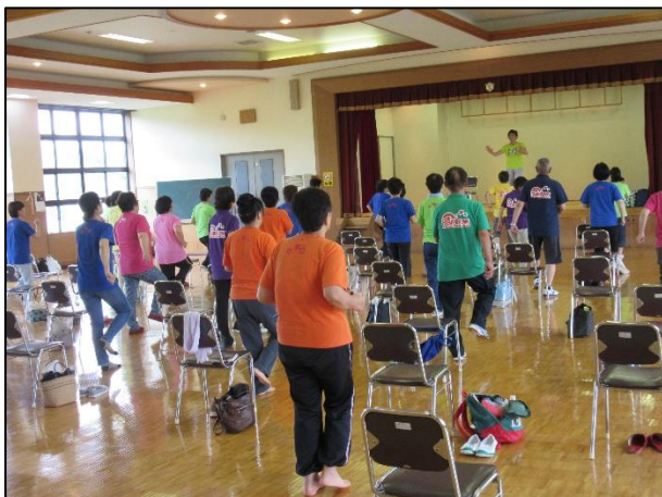
H30.7.10 お試し筋力づくり教室 @一之沢林業集会センター