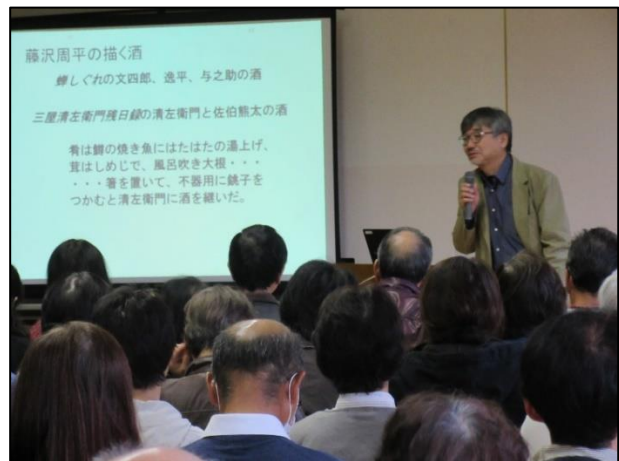
平成30年度 第5回研修会「お酒と健康を考える講演会」