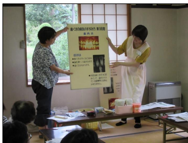
H30.9.4 お口の健康教室@西泉田公民館