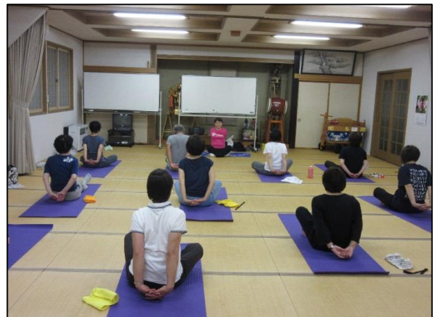
H30.6.29 スリムアップ教室 @原芝野集落開発センター