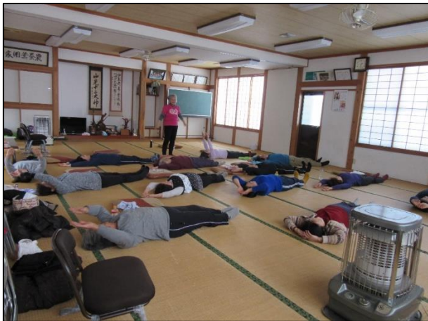
H29.2.7 筋力づくりお試し教室 @新堀新田集落センター