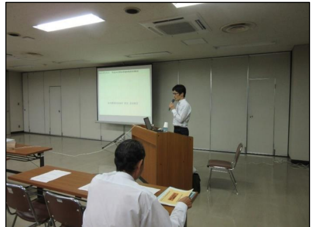
平成29年度 第4回研修会「家族みんなで考える、禁煙支援！」