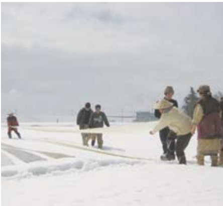
越後上布の雪さらし

南魚沼市では、昨年4月の「天地人」放送決定以来、南魚沼地域振興局や市内の歴史団体など関係する皆さんからご協力をいただき、教育や観光を中心とする関連事業を行ってきました。