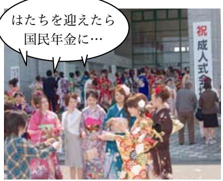
はたちを迎えたら国民年金に…