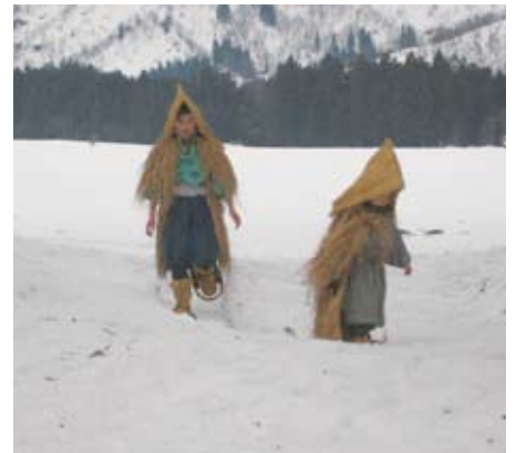
がんばった子役のふたり

天候に恵まれて撮影が順調に進んだことや、撮影現場近隣の住民の皆さんからの協力に対して、撮影スタッフの皆さんから大変喜ばれました。特に、差し入れていただいたオニギリの評判は高く、「さすが、日本一のコメ処」という評価をいただきました。