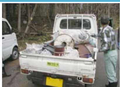
昨年の取り組み状況 ご協力ありがとうございました