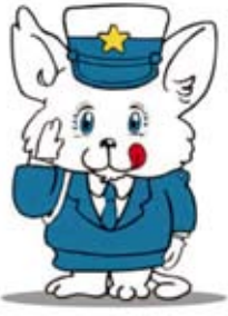
新潟県交通安全マスコット ルルちゃん

6月1日施行の道路交通法改正により、改正前は努力義務であった後部座席などの同乗者のシートベルト着用が完全義務化されます。