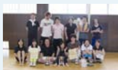
ゴールド・ブロンズクラス優勝「STINGREIビーチ」

★ ソフトバレーボール バトミントンコートに2mのネットを張り、専用の柔らかいボールを使った4人制のバレーボールで、誰でも気軽にできることが魅力です。第15回市大会を6月29日(日)塩沢中学体育館で行い、ブロンズクラス16チーム、ゴールド・プラチナクラス7チームで熱戦が繰り広げられました。県外からの参加者もあり、年々盛り上がりが増しています。秋の大会を11月2日(日)に予定。たくさんの参加チームをお待ちしています。