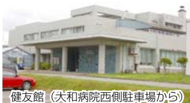
健友館（大和病院西側駐車場から）

乳幼児健診は、決められた対象月に受診することが、お子さんの成長を確認する意味からも大切です。予定された対象月にきちんと受診ください。