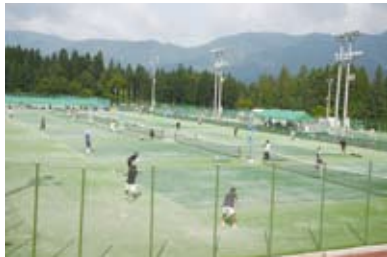
大原運動公園 テニスコート