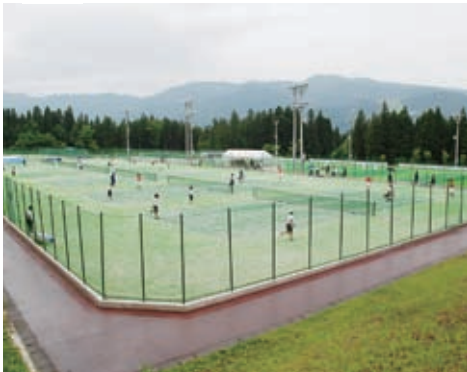
大原運動公園テニスコート