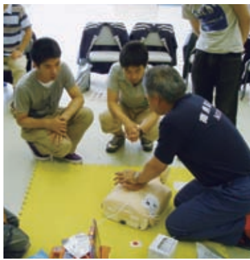
心臓マッサージの講習

いざというときのために応急手当を学びませんか?心肺蘇生法、AED(自動体外式除細動器)の取扱いなど、実技を中心とした講習会です。初めての方も受講経験のある方も気軽にご参加ください。