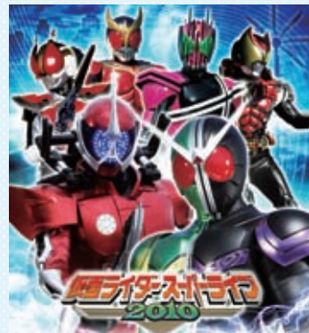
会場EXPO21館の最上階を走るスーパーライブ!

戦国EXPO運営委員会とU×新潟テレビ21との共催で「仮面ライダースーパーライブ2010」を開催します。目の前で仮面ライダー達のかっこいいアクションが繰り広げられます！ぜひご家族そろっておいでください。仮面ライダー関連グッズの販売も行います。