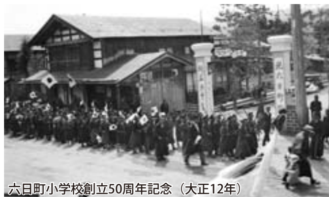
六日町小学校創立50周年記念（大正12年）