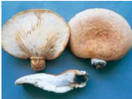
「きのこ食中毒に注意」チラシ ツキヨタケ (内部にシミがあることが多い)

また、南魚沼保健所管内で「きのこ講習会」を実施しますのでご参加ください。※事前申し込みは不要です。