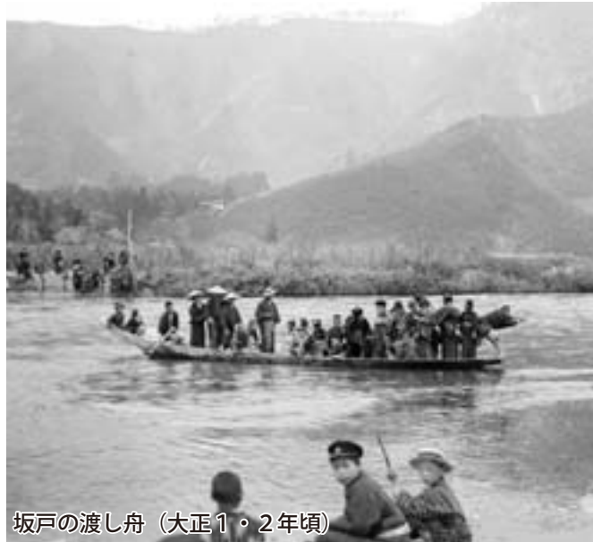
坂戸の渡し舟（大正1・2年頃）