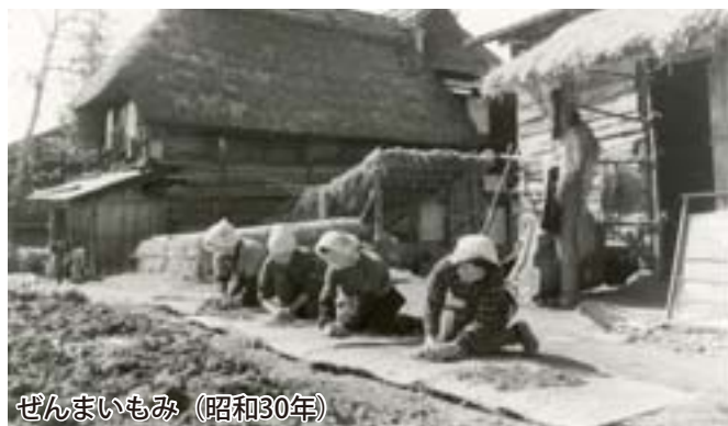
ぜんまいもみ（昭和30年）