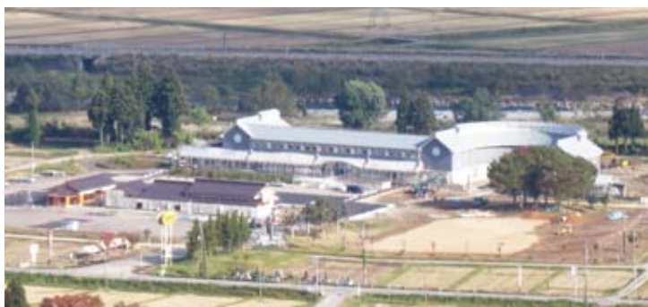
整備が進む観光交流拠点施設

受賞されたお2人につきましては、来年度のオープンの際、表彰式および副賞の授与を行う予定です。