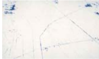
越後平野 AB 100号 1983

ニューヨークへ留学した富岡は、自らの美の原点は日本の雪景色にあると確信し、帰国後、日本各所をめぐる「雪国巡礼」を開始します。日