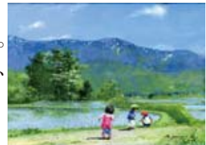
櫻井幸雄 「ムニヤムニヤ語 (早苗)」

「出番のないベンチ」、「遠いゴール」、「ムニヤムニヤ語」シリーズの、可愛らしく優しい仕草の子どもたちには将来の希望と夢を抱かせます。心をなごませる油彩画を中心に約40点を展示します。