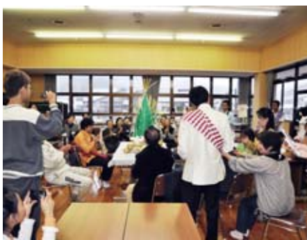
2010年 ラオスの皆さんとの交流