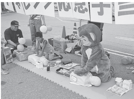
チャレンジ応急手当