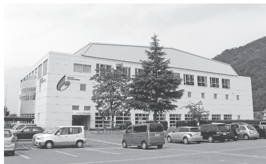
南魚沼市スポーツコミュニティセンター