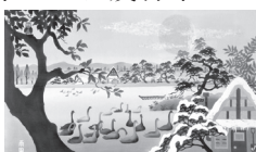
「静かなる夜(瓢湖)」 ロウ染め M100号