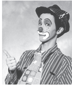
ピエロのごっしー