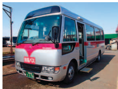
小型路線バスタイプ