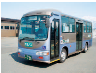
マイクロバスタイプ