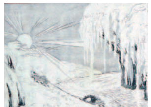
「笄掛岩大氷柱図」部分

清水村の手前、登川の中に、「 おいかけいわ 笄掛岩」という大きな岩 つらら があり、冬になると大きな氷柱ができました。この絵には、朝日に照らされ輝く大氷柱と、雑木を載せたそりを引く男たちが描かれています。