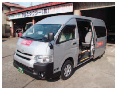
コミュニータータイプ