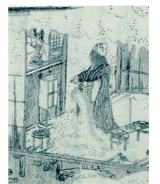
「雪中幽霊之図」部分

関山〔現在の石打地区〕の五十嵐橋から落ちて亡くなった女の幽霊を成仏させるために、僧侶が幽霊の髪を剃っている場面が描かれています。この時、僧侶の手に残った髪の毛を埋めて供養した「毛塚」が今も残っています。