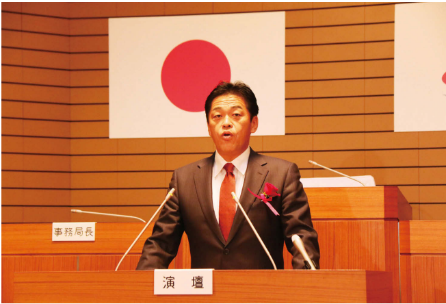
初登庁後、職員に向けて訓示を行いました