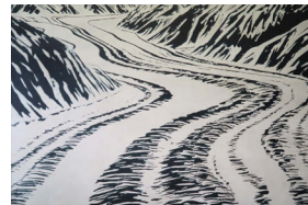
「アラスカ氷河・イベントナー A」