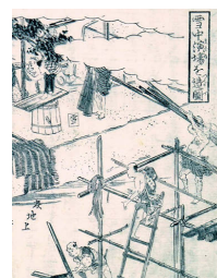
「雪中演場を造図」部分

江戸時代、塩沢では地芝居が盛んに行われ、2・3月の上演には雪で舞台を造りました。この絵には舞台を造る人や芝居の練習をする人など、さまざまな人物が描かれています。