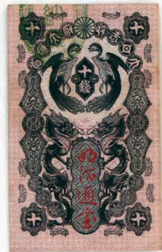
写真2 「明治通宝」十銭紙幣

これら以前の江戸時代から明治の初めにも各藩、所領、宿場、村や特定の地域で通用する紙幣が発行され、藩札、村通用札などと呼ばれていま