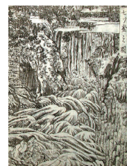
みなつがまのす 「七ツ釜之図」部分

名勝・天然記念物として知られる「田代の七ツ釜」は、北越雪譜の中にも登場します。牧之は「その不思議な景観はとても書きつくせない。第7番目の釜(滝つぼ)を図にしたので、これを見てその有様を知ってほしい」と記しています。