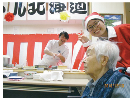
握りたての寿司を食べるなど、楽しい行事を行っています。