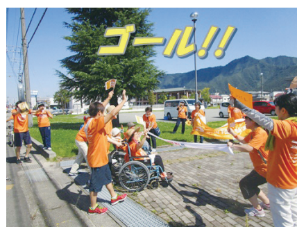
ランとも「RUN伴」など地域の行事に参加しています。

また、全職員を対象に専任の保健師が各施設で「移動保健室」を実施し、健康相談などの「こころとからだの健康づくり」を継続し、働きやすい職場を目指しています。