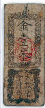
写真1 太政官札（金一朱）

現在、政府が発行する紙幣は、慶応4年（1868年）に発行された「太政官札」（写真1）、明治5年（1872年）に発行された「明治通宝」にはじまります（写真2）。