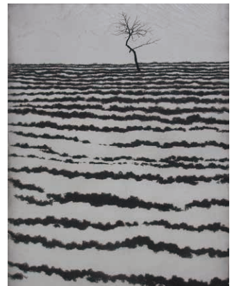
「裏磐梯・一本の木」

雪で覆われた山並みや、吹き付ける雪に静かに耐え忍ぶ木々、美しい枝ぶりを現す樺など、山と樹木を描いた作品を中心に展示。