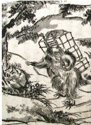
さんちゅう いじゅう 「山中異獣の図」部分

おにぎりをもらったお礼に重い荷物を背負ってくれる異獣を描いたこの挿絵は、『北越雪譜』の中でも特に有名です。見た目は、毛むくじゃらで爪が鋭く恐ろしい姿ですが、心のやさしい異獣です。