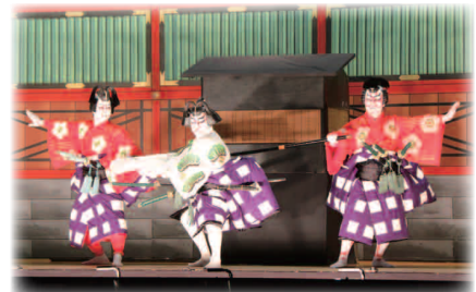
地歌舞伎 平成29年演目 すがわらでんじゆてならいかのみ くるまびき ば 菅原伝授手習鑑 車引の場