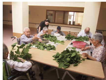
春に植えた枝豆が収穫時期を迎え、施設の利用者が手もぎしました

職場環境を整えることで、一層利用者が笑顔で過ごしていただける支援をめざしています。