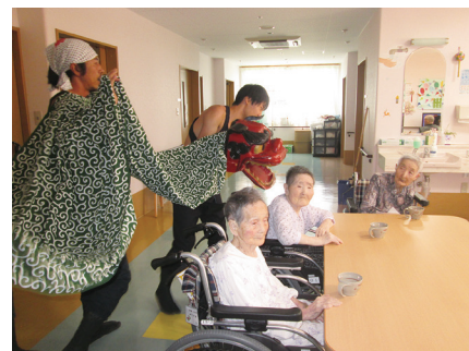
地区の伍社神社から施設に獅子神楽が巡行しました