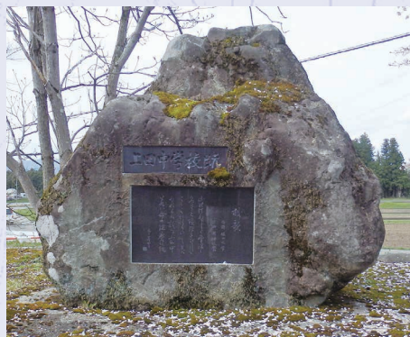
「上田中学校跡」 「長崎」