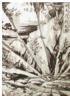
「剛夫得名玉図」部分