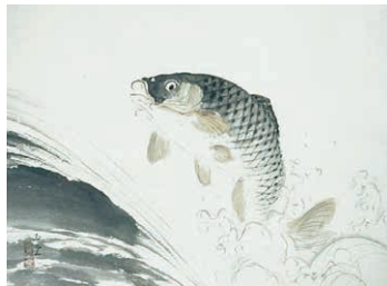
川合玉堂「飛躍鯉の図」