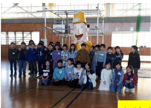
レルヒさんと記念撮影