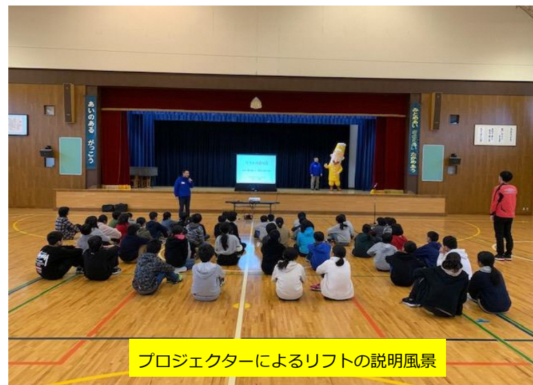
プロジェクターによるリフトの説明風景

北陸信越山岳観光索道協会 新潟地区部会では、各地区における小学校のスキー授業が始まる前に、スキーを滑る上での正しいルールやリフトの乗車方法をわかりやすく説明しております。今年で6年目となりますが、事前講習を実施している事が充分周知されていない状況です。保護者ならびに学校関係者の負担軽減のためにも、対象学校を今後も拡充していく必要があると思われま。