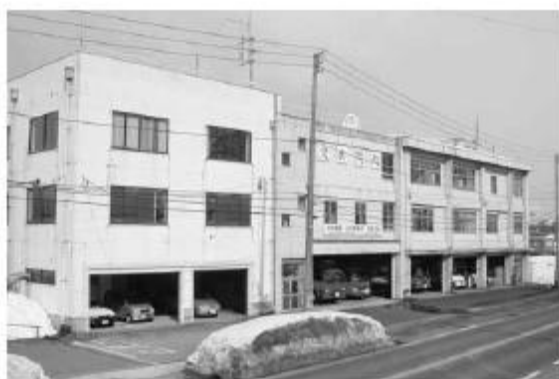
南魚沼市消防本部・消防署