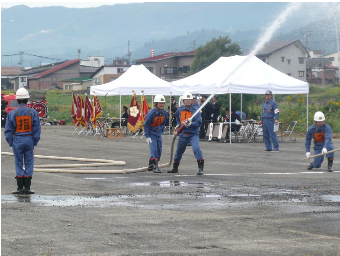
平成 22 年 10 月 17 日 六日町方面隊秋季演習（於：魚野川河川敷）