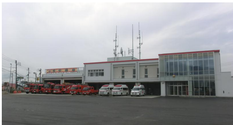
南魚沼市消防本部・消防署