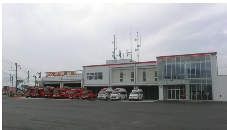
南魚沼市消防本部・消防署