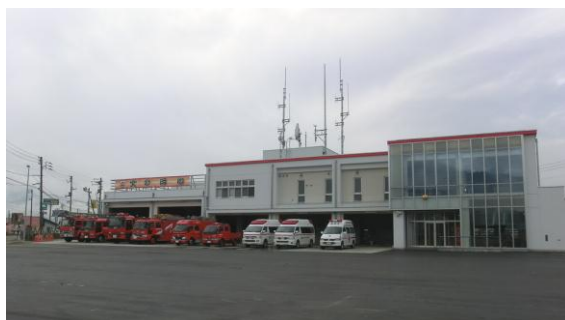
南魚沼市消防本部・消防署