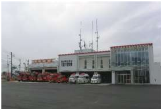
南魚沼市消防本部・消防署