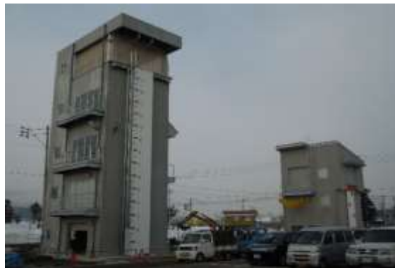
消防訓練主塔・副塔