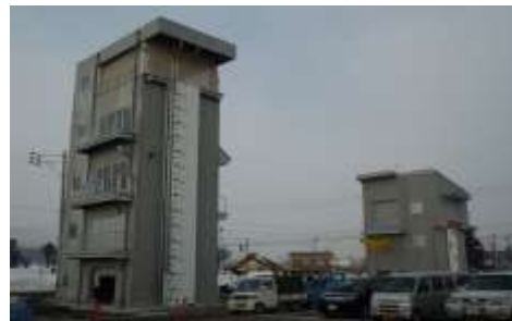
南魚沼市消防署訓練塔