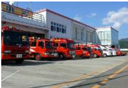
南魚沼市消防本部・消防署