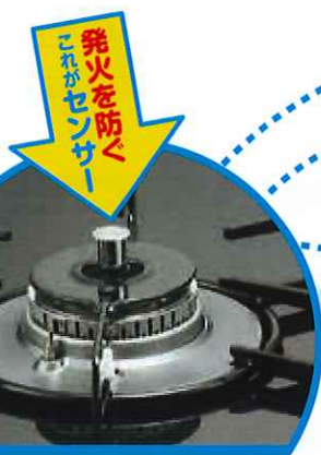
センサー搭載 コンロの一例