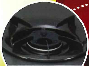
センサー非搭載 コンロの一例