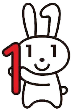
マイナンバー公式PR キャラクター「マイナちゃん」