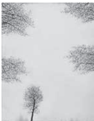
「早春・梢-セントラルパーク」

開館して30年経った今でもトミオカホワイトは変わらぬ白で人びとを魅了しています。