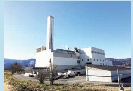
不燃ごみ処理施設