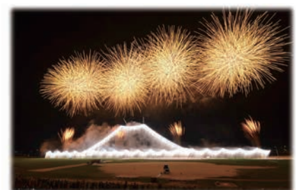
江戸川区花火大会

江戸川区花火大会では、毎年約1万4千発の花火が夜空を彩ります。主な特産品には、江戸川区の地名から名付けられた小松菜などがあります。