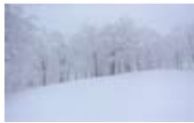
八海山の樺の雪森

北海道の写真家 渡辺洋一さんが、日本の雪山に活動の場を置き、雪の森を主体に記録した写真を展示します。環境問題にも目を向けている渡辺さんは、作品を通して、人と森の共生について考えるきっかけになればと願っています。