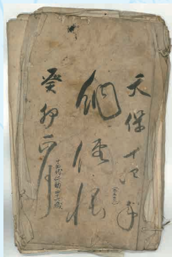
写真2 『納経帳』のご朱印など