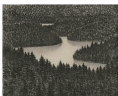
「阿寒ペンケパンケ湖」