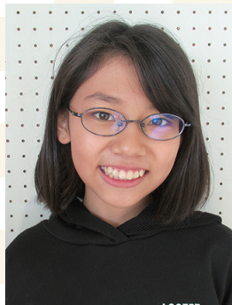
おおまき小学校 6年