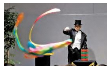
図書館新年会「楽しいマジックショー」