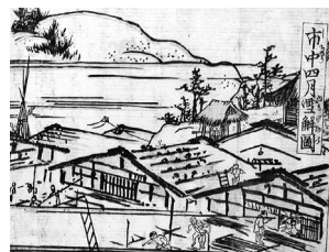
「市中四ヶ月雪解図」部分

雪解けを迎えた塩沢を描いた挿絵です。冬囲いを外す人や、屋根の上で雪で傷んだところを点検しているような人、舩あげをしている様子が描かれています。春の喜びがあふれている挿絵です。