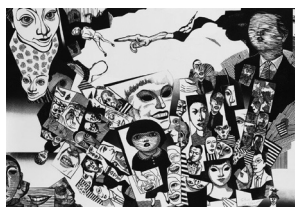
上野道『曇気楼の中で』2017年

魚沼に現代版画の魅力伝えたいと、海外の版画家12人を含む23人が出展します。いずれも世界で活躍する版画家です。