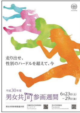
走り出せ、性別のハードルを超えて、今