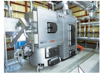
牧之保育園にペレットボイラーを設置しました