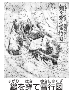
すがり はき ゆきにくず 縄を穿て雪行図