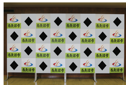
◆の部分に広告を掲載します。