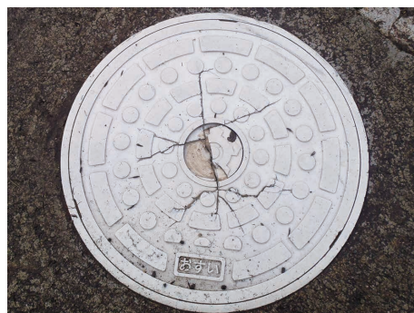
ひび割れて交換が必要な公共マス