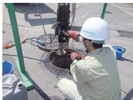
ポンプに詰まったタオルを取除く作業