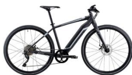
電動スポーツタイプ 20 台