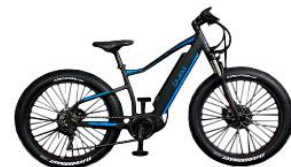
電動ファットバイク 3 台

お問い合わせ 〒949-6424 新潟県南魚沼市万条新田 417 番地 大原運動公園 (株)ベースボール・マガジン社 電話: 025-783-3533