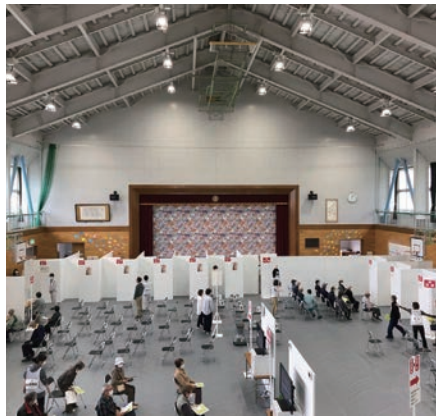
ワクチン集団接種会場の様子

ら、新型コロナウイルス感染症にかかる予防接種を推進します。 令和4年度は子宮けいがん予防ワクチン（HPVワクチン）について、未接種者に対して適切に勧奨を進めます。