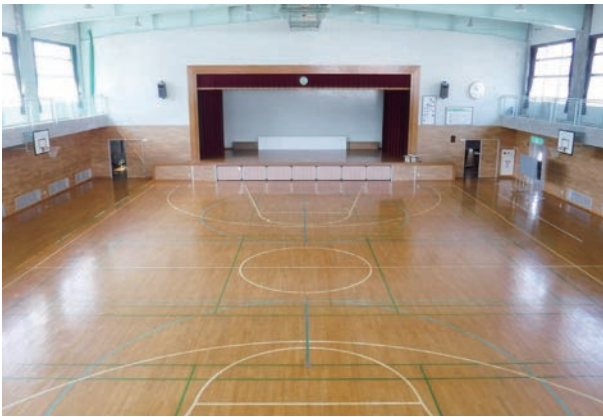
旧第二上田小学校体育館

これまで室内で受け入れができなかった硬式野球、硬式テニス、サッカーなどの球技スポーツにも対応した、全天候型の多目的室内スポーツ施設として旧第二上田小学校体育館を改修し、健康増進・スポーツ人口の拡大をめざします。