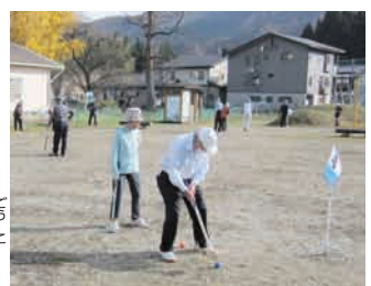
グラウンドゴルフの様子

(我が家の宝物(田村豪湖展)) 中之島地区のお宝同好会が主催する展示会を開催しています。今年も10月ごろに開催予定です。