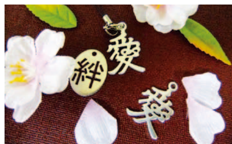
遊び心で作った試作品