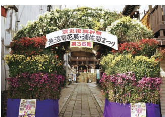
第36回魚沼菊花展・浦佐菊まつりの様子