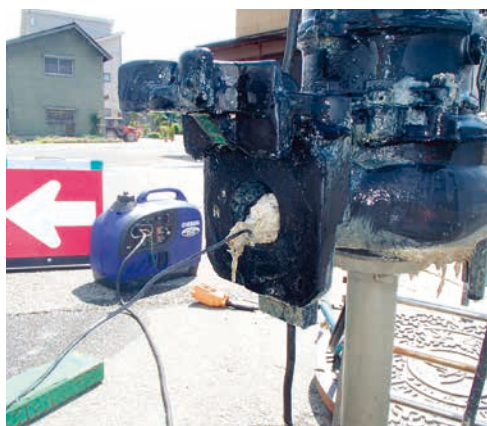
ポンプに詰まったタオル (写真中央)

処理場などで、家庭から流されたと思われるタオルやおむつがポンプを詰まらせる事故が多発しています。ポンプが停止すると汚水は流れず、マンホールや宅内ますから汚水があふれます。