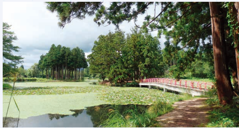
上の原池弁天島と弁天橋（左奥が戸隠島）