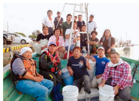
レクリエーションの様子

建設業は、社会資本の整備という大切な役割を担っています。それにもかかわらず、業界のイメージがあまりよくないことに心を痛めています。そのような状況にありますが、当社では、新卒の社員に有給で1年間職業訓練校に通学してもらい、電気工事の資格を取ってもらう取組みなどを行い、社員の定着率が90%となっています。技術・知識・経験・資格など、学校を卒業して就職してからが本当の勉強です。向上心を持つみなさんの入社をお待ちしています。