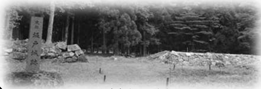
国指定史跡 坂戸城跡