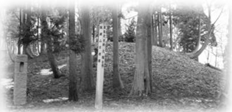
県指定史跡 飯綱山古墳群