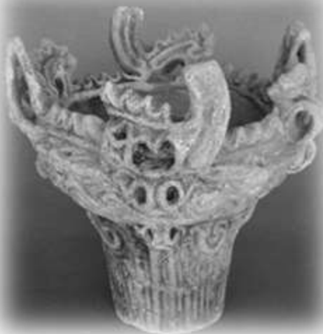
原遺跡出土 火焰型土器