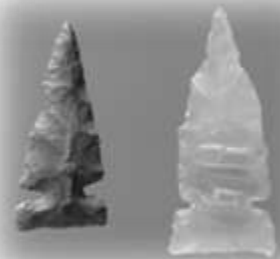
飯綱山遺跡出土 アメリカ式石鏃