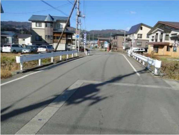
平成 29 年度（伊田川橋 3：市道目来泉盛寺線）