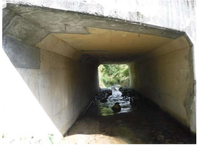
頂版・側壁断面修復（新保橋）