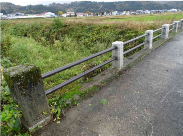
高欄補修（名木沢川橋 5）