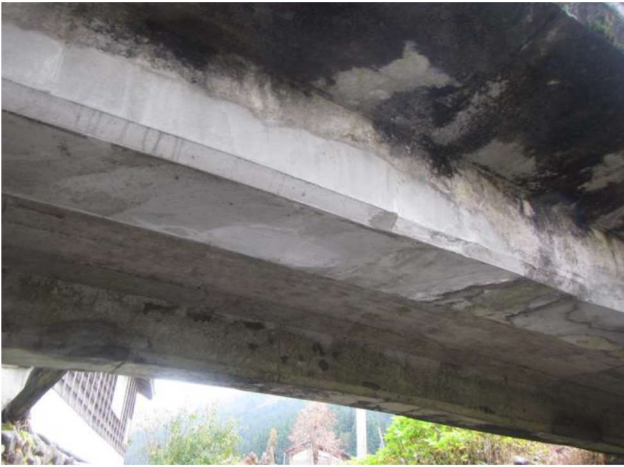
主桁断面修復（舞子川橋 1）