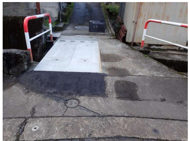
床版補修（刑部沢 3 号橋）