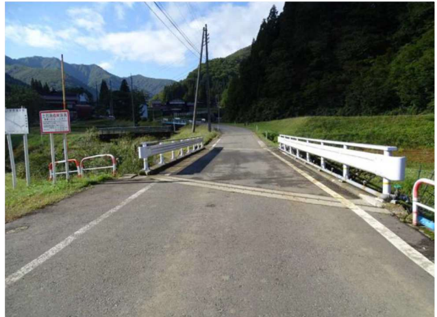
伸縮装置交換・主桁ひびわれ注入（一之沢川橋）