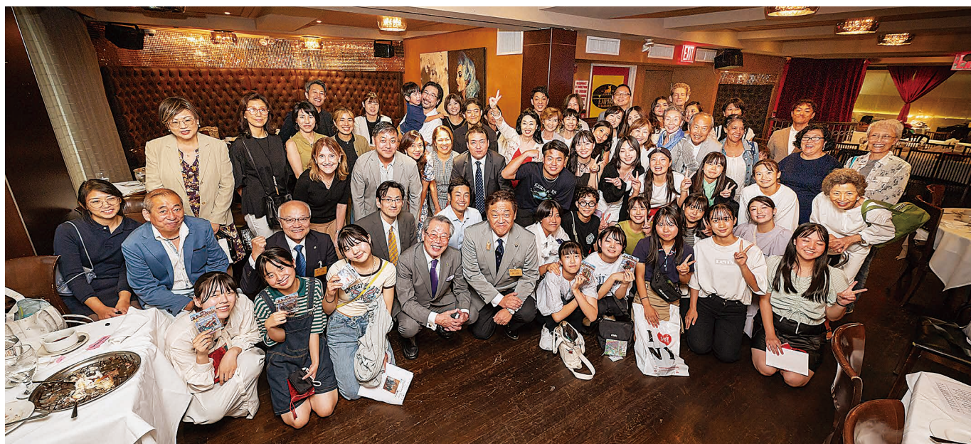
ニューヨーク新潟県人会歓迎会