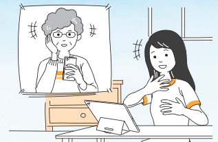
●家族や友人との会話